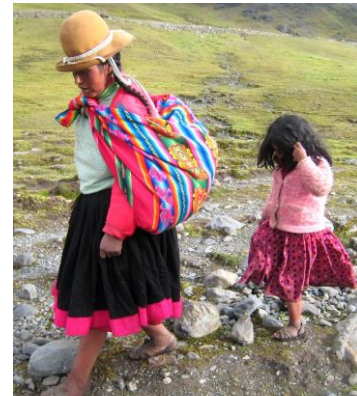
Quechuas in den Anden

Alle Führungen finden in Spanisch statt und werden ins Deutsche gedolmetscht. Während der gesamten Reise sind sowohl eine deutsche Reisebegleitung als auch indigene Tourguides bzw. Spezialisten für die Regionen anwesend. Bei Yakumama Tours wird auf Luxus verzichtet und dafür mehr Wert auf die inhaltliche Gestaltung des Programms gelegt. Wir reisen langsam, denn auch die Details am Wegesrand können uns überraschende Erkenntnisse vermitteln. Wir werden oft zu Fuß gehen, dorthin, wo es keine Verkehrsmittel gibt: auf die Berge, in den Urwald, zu Menschen, die noch in einem natürlichen Umfeld leben, und zu den archäologischen Stätten, die uns heute noch vieles über längst vergangene Kulturen verraten.