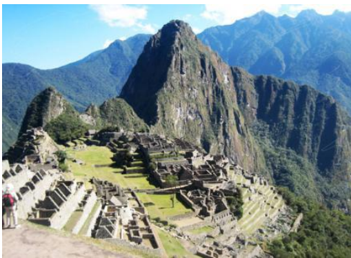
Machu Picchu und Huayna Picchu

Spezielle Rabatte für Mitglieder des Lateinamerika-Forums Berlin e.V.