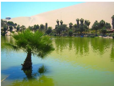
Die Oase Huacachina in Ica

Wir besuchen die alte Inka-Hauptstadt Cuzco und das heilige Tal der Inkas, wo wir bei einer Pachamanca, einem rituellen Essen zu Ehren von Mutter Erde, Begegnungen mit Quechuas haben werden. Auf einer Bergwanderung über den Salkantay-Gletscher zur magischen Ruinenstadt Machu Picchu werden wir das Leben in freier Natur selbst ausprobieren und den klimatischen Wechsel von schneebedeckten tropischen Gebirgen bis hin zu warmen Tälern spüren.