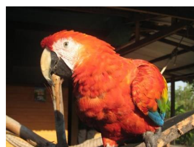
Ein Papagei in Puerto Maldonado

Eine weitere faszinierende Region ist der Urwald des Amazonas-Gebietes mit seiner üppigen Vegetation, riesigen Bäumen, exotischen Pflanzen und Tieren. Wir werden mit dem Boot zu einer Lodge in der Nähe von Puerto Maldonado fahren und von dort aus kleine Exkursionen in den Dschungel unternehmen.